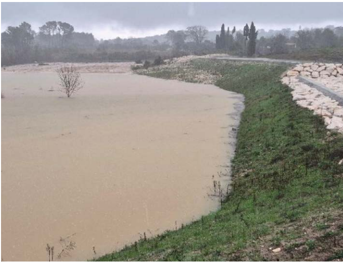
Vue en amont du barrage du bassin G à 11h15

Ce premier épisode pluvieux majeur depuis la fin des travaux confirme leur rôle déterminant dans la protection de la commune contre les inondations.