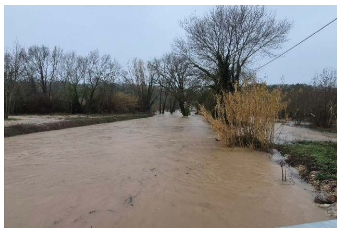
Vue en aval du pont des écoles à 12h15 @3MGEMAPI

La vigilance orange prend fin le mardi 23 décembre à 9h30 .