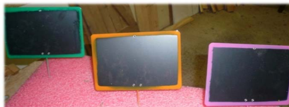
Premières étiquettes artisanales du marché de Grabels

Ce marché en circuits courts a aussi été construit en concertation avec les commerçants du village, qui peuvent venir y proposer leurs produits. La décision de proposer le marché le samedi est notamment une façon de ne pas gêner les commerces de détail qui réalisent une partie importante de leurs chiffres d'affaires le dimanche.