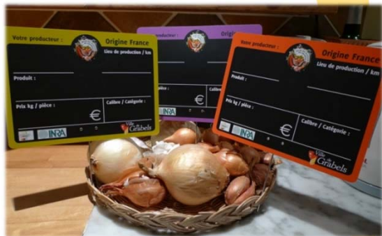
Ci-dessus : étiquettes/piques-prix mis en place sur le marché de Grabels

Permettre aux consommateurs de choisir et à tous de suivre les engagements : le système d'étiquetage suppose que les exposants soient transparents par rapport à l'origine de leurs produits. La signalisation de l'origine donne alors aux consommateurs la possibilité de faire des choix au moment de leur achat, selon ce qu'ils souhaitent privilégier. Dans le même temps, elle facilite le suivi des engagements par le comité consultatif, mais aussi par les clients et autres exposants.