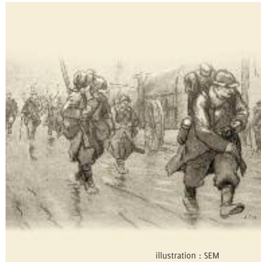
illustration : SEM

(1) En vente Maison du Pakistan et Tabac-Presses Poux à Grabels.