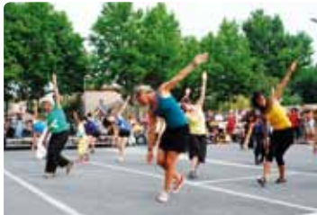
Parking Jean Ponsy