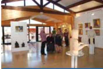
Salle de la Gerbe - Rue de la Gerbe