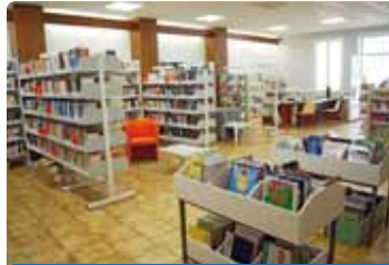
Bibliothèque Pour Tous Rue du presbytère