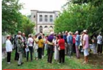
Parc du Château de Grabels Rue du Château