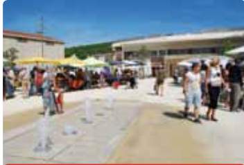
Place Jean Jaurès