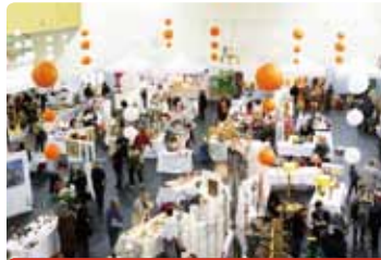
Salle polyvalente - Rue Mgr J. Roucairol