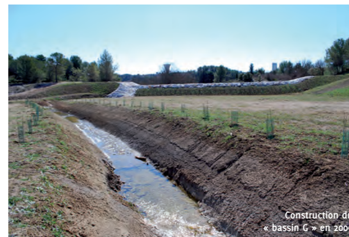
Construction du « bassin G » en 2009

Le bassin de rétention de l'arbre blanc, dit « bassin G », sera agrandi. La compensation de ce bassin passera de 27 500 à 160 000 m 3 . Cet aménagement préserve cette zone humide classée de tout terrassement.