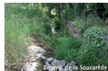
En aval de la Soucarède

Pour permettre les travaux, la Commune a acquis (grâce au « fonds Barnier ») puis détruit le Moulin de la Grave et le Mazet de la Soucarède, transformés depuis en jardins.