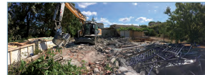
En 2019, destruction d'une maison en bordure du Rieumassel pour réaliser les travaux de suppression d'un goulet d'étranglement.

Des travaux de recalibrage et de création d'un merlon (talus) sont prévus le long du Redonnel pour orienter les écoulements. Pour cela des acquisitions foncières sont nécessaires, des segments de parcelles (jardins de particuliers) sont rachetés par la Métropole et vont être aménagés. Une habitation a été acquise pour être détruite.