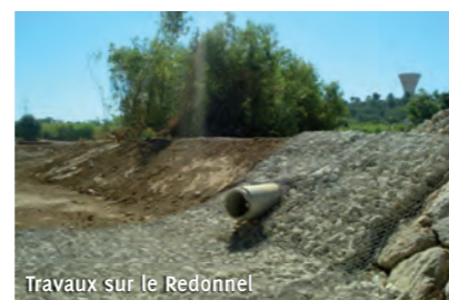
Travaux sur le Redonnel

Il s'agit d'augmenter le volume de rétention du « bassin G », d'élargir le lit du Rieumassel par endroits et d'orienter les écoulements sur le Redonnel.