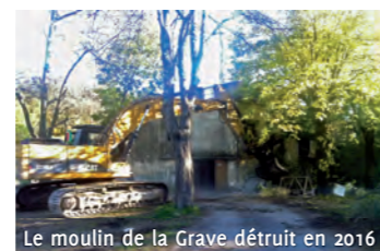
Le moulin de la Grave détruit en 2016

Ces aménagements terminés, une étape décisive dans la protection du territoire de Grabels et de ses habitants aura été réalisée.