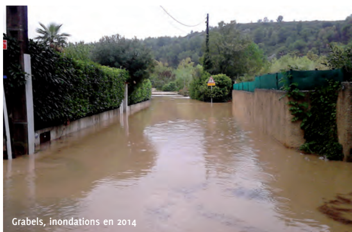
Grabels, inondations en 2014