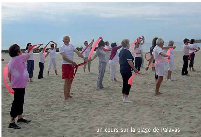
un cours sur la plage de Palavas